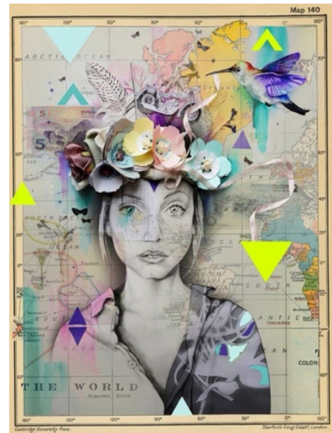
Referencia de imagen:

¿Qué harán? Reforzar la idea de la discriminación a través de elementos complementarios de la imagen (autorretrato), a través de las palabras, consignas, elementos expresivos, etc.