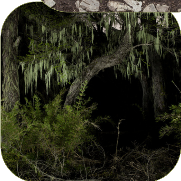
Fotografías: Fernando Melo

fernando-melo-pardo.webnode.cl @fernando_melo_pardo