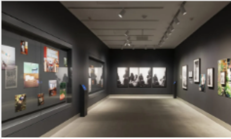
PhotoLab 6: New Generation Photography Award Exhibition

View works of art by the three winners of the 2019 New Generation Photography Award