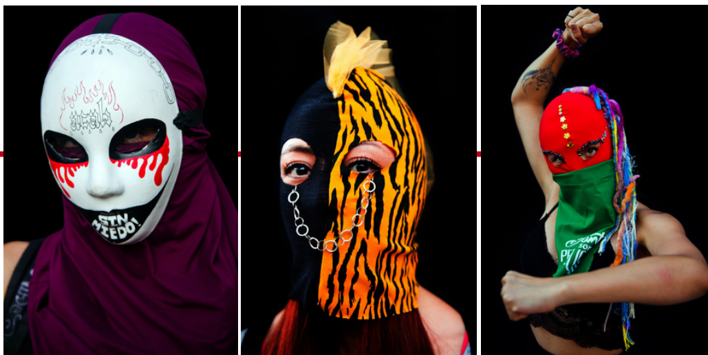
Fotografías de Bastian Cifuentes

La docente presentará de forma visual y audiovisual la obra fotográfica de Bastián Cifuentes, fotógrafo referente de este proyecto.